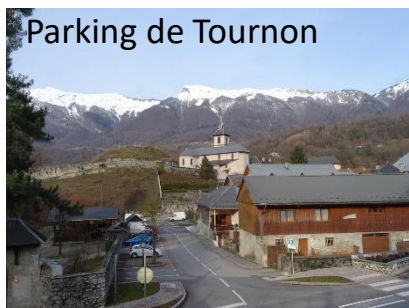
Parking de Tournon