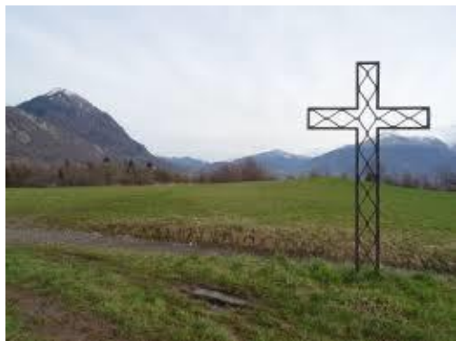
Verrens-Arvey Carte postale ancienne